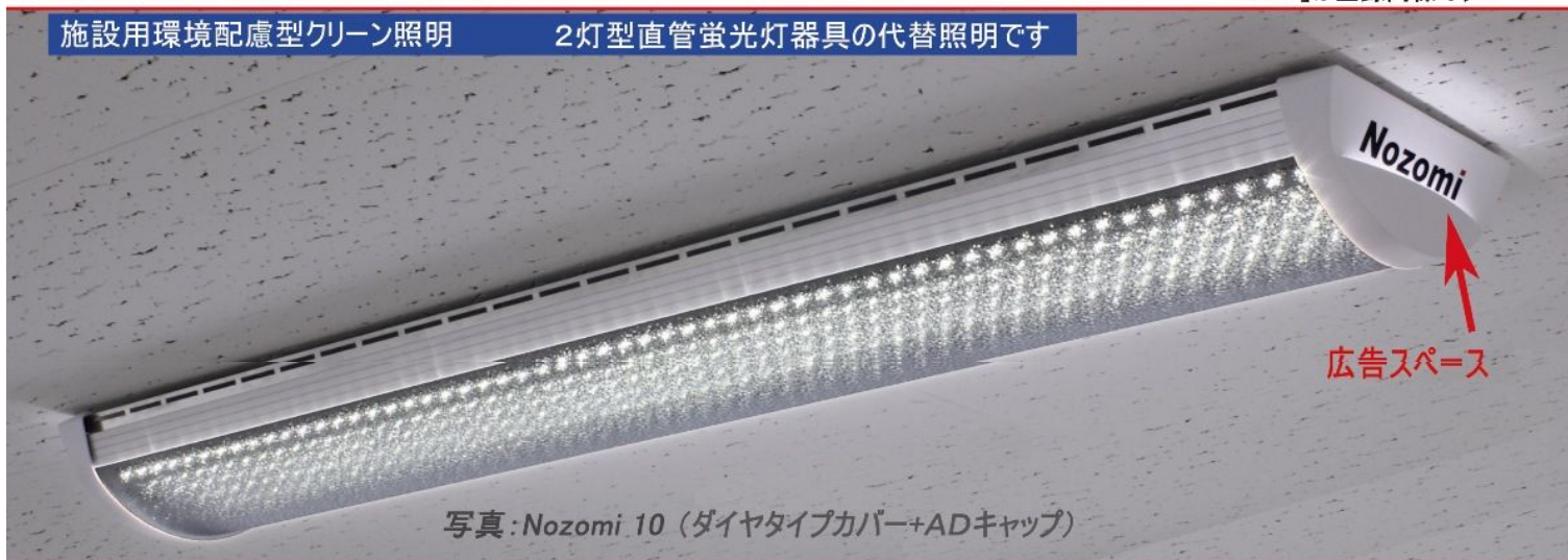
写真: Nozomi 10 (ダイヤタイプカバー+ADキャップ)

LED照明が大きく変わります 10年後を見据えた、次世代LED照明「のぞみ ® 」 「のぞみ ® 」がひかりの未来を創ります！