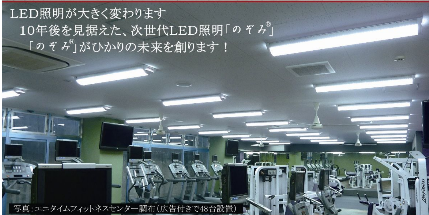
写真: エニタイムフィットネスセンター調布 (広告付きで48台設置)

LED照明が大きく変わります 10年後を見据えた、次世代LED照明「のぞみ ® 」 「のぞみ ® 」がひかりの未来を創ります！