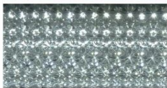
クリスタルタイプ